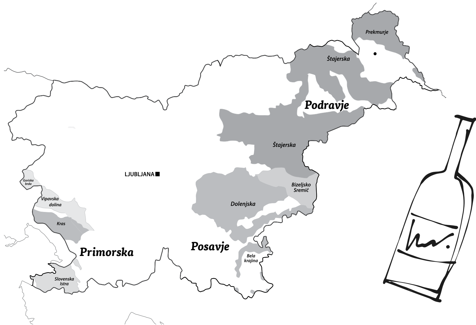
Vinska karta Slovenije / Slovenia wine map